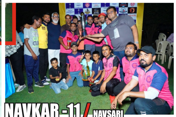
NAVKAR -11 / NAVSARI