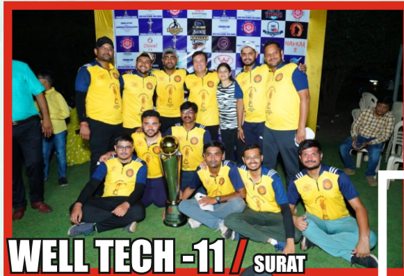
WELL TECH -11 / SURAT